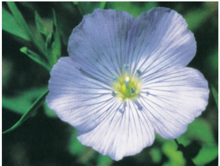
Quellmittel wie Leinsamen (Bild) brauchen viel Wasser, um wirken zu können.

gewohnt funktioniert. Deshalb wollen wir dieses Thema aufgreifen und Ihnen helfen, mehr über die Ursachen und Behandlungsmöglichkeiten einer Verstopfung zu erfahren.